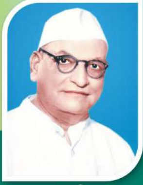
पद्मश्री कर्मवीर काकासाहेब वाघ